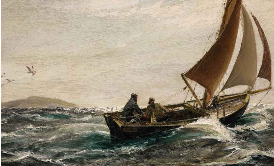
1916, With Wind and Tide – Off The Dodman-Head, Falmouth; Charles Napier Hemy (1841-1917)

La mer attire des milliers de gens, venus passer un week-end ou des vacances sur la côte. La plage, l'air frais, l'immensité de la mer. Bref, une promesse de bonheur.